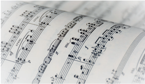
Konzert Männerchor Chur