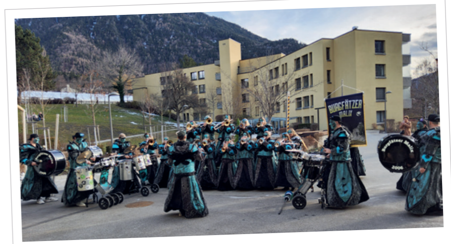
Burgfätzer Malix · 17. Januar