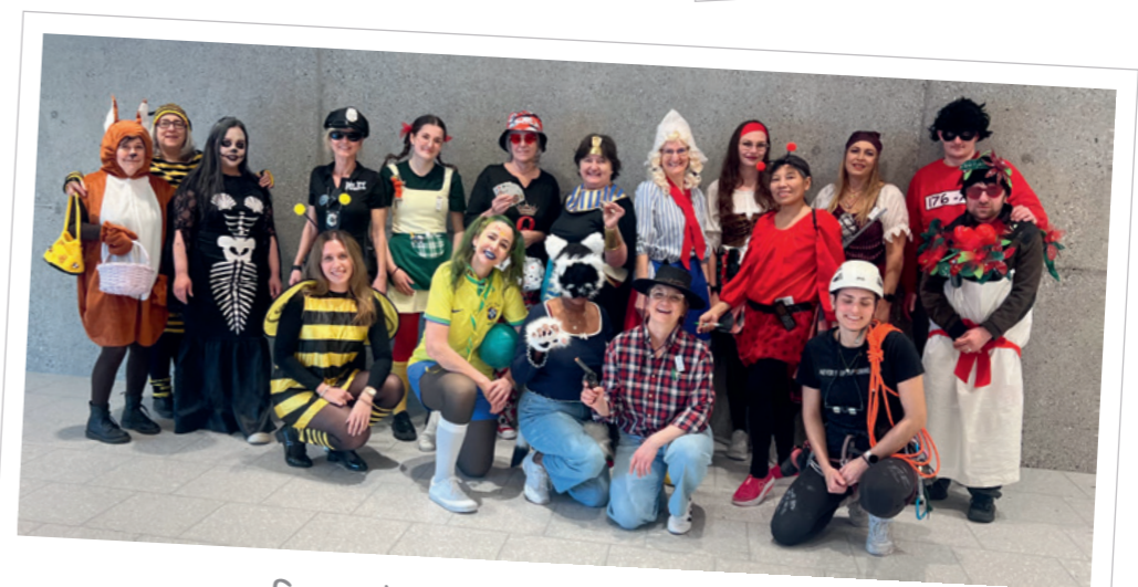
Fasnacht im Kantengut · 16. Februar