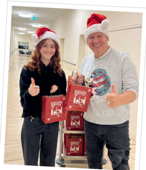
Honig verteilen · 24. Dezember