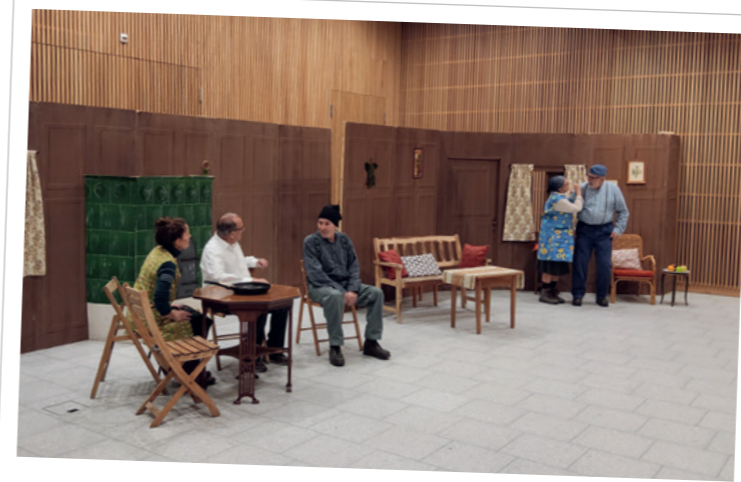
Berner Theater Verein · 1. Februar