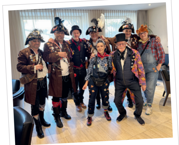
Schnitzelbänke · 7. Februar