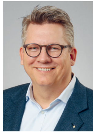
Liebe Leserinnen und Leser

Das neue Jahr hat begonnen, wie das alte geendet hat – mit einem Kopfschütteln für das, was politisch auf dieser Welt passiert.