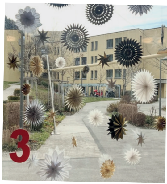
Adventsfensterfeiern · Dezember